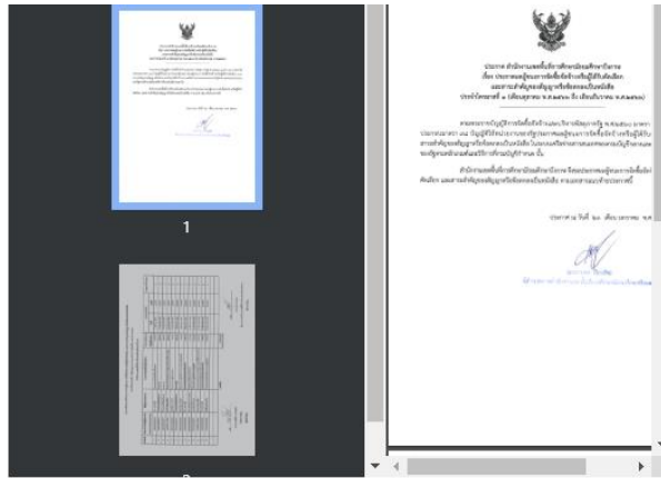
ประกาศขมายทอดตลาดอาคารหอประชุม-แบบ ๒๐๓๗ ข่าวมีสื่อมีใจจ่าง